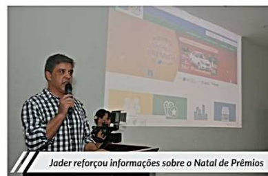
Jader reforçou informações sobre o Natal de Prêmios