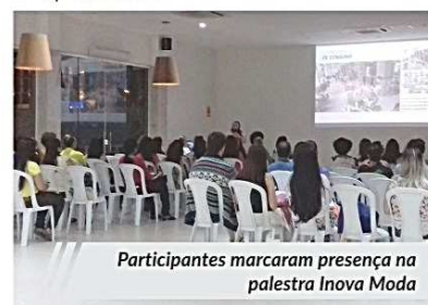
Participantes marcaram presença na palestra Inova Moda

contou com a participação de 64 pessoas.