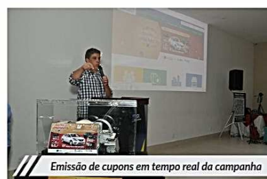
Emissão de cupons em tempo real da campanha