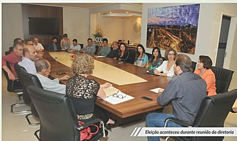
Eleição aconteceu durante reunião da diretoria