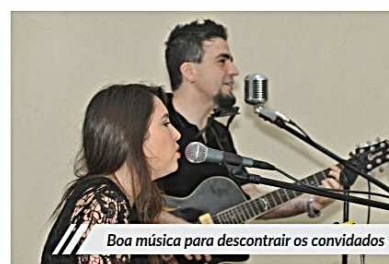
Boa música para descontrair os convidados