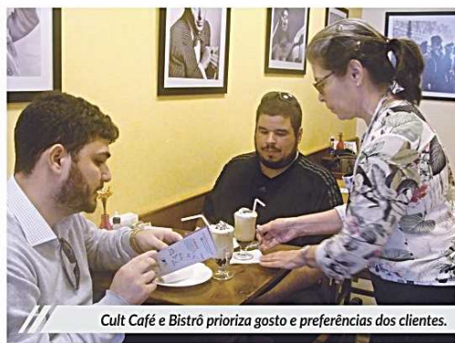
Cult Café e Bistrô prioriza gosto e preferências dos clientes.

Chega o calor e as vendas de alimentos leves e gelados aumentam. Cafeterias, distribuidoras de polpas e outras empresas do ramo alimentício já começaram a se preparar para o Verão, que começa no dia 21 de dezembro. A fim de atender à demanda com os produtos mais requisitados, foram realizadas alterações no cardápio padrão.