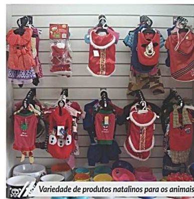
Variedade de produtos natalinos para os animais

A Pet Sublime também não fica de fora das comemorações de fim de ano. Desde o primeiro ano de funcionamento da empresa, há um cuidado maior em proporcionar uma variedade de produtos. Entre eles, estão vestidos, capas, coleiras, bandanas e laços, tudo personalizado.